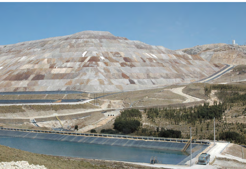
Trotz Nachhaltigkeitskapitel senkte die peruanische Regierung ihre Schutzmaßnahmen für die Umwelt

Seit 2013 wendet die EU die Freihandelsabkommen mit Peru und Kolumbien vorläufig an. Beide Abkommen enthalten ein Nachhaltigkeitskapitel, das vorsieht, dass eine regierungsunabhängige Beratungsgruppe (DAG) eingerichtet wird. Die Regierungen Perus und Kolumbiens blockieren jedoch seit Jahren die effektive Umsetzung einer solchen zivilgesellschaftlichen Beratungsgruppe. Dies ist besonders kritisch, da in den letzten Jahren die Repressionen gegen UmweltschützerInnen und MenschenrechtsverteidigerInnen in beiden Staaten stark zugenommen haben. Neue Gesetze diskriminieren Nichtregierungsorganisationen und die Regierungen verhängten wiederholt den Ausnahmezustand über mehrere Provinzen, in denen die Bevölkerung gegen die massiven Umweltschäden des Bergbaus protestierte. 2 Zudem wurden Bestimmungen zum Umweltschutz zurückgefahren und Verpflichtungen aus multilateralen Klimaabkommen nicht wirksam umgesetzt. Das zivilgesellschaftliche Bündnis Plataforma Europa-Perú (PEP) reichte daher im Oktober 2017 eine umfangreiche Beschwerde bei der EU-Kommission ein. 3 PEP forderte die EU schließlich dazu auf, das Streitschlichtungsverfahren des Nachhaltigkeitskapitels zu aktivieren und in Regierungskonsultationen mit Peru einzutreten. Davor schreckt die EU-Kommission jedoch zurück. Stattdessen übermittelte die europäische Handelskommissarin