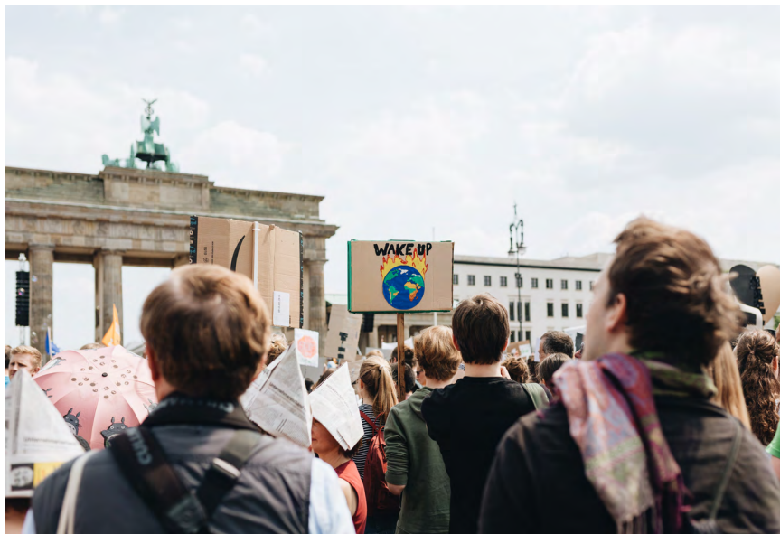
Fridays For Future protestieren für Klimaschutz in Berlin

Für einen effektiven Umweltschutz genügt es nicht, internationale oder europäische Umweltnormen durch ihre Erwähnung in